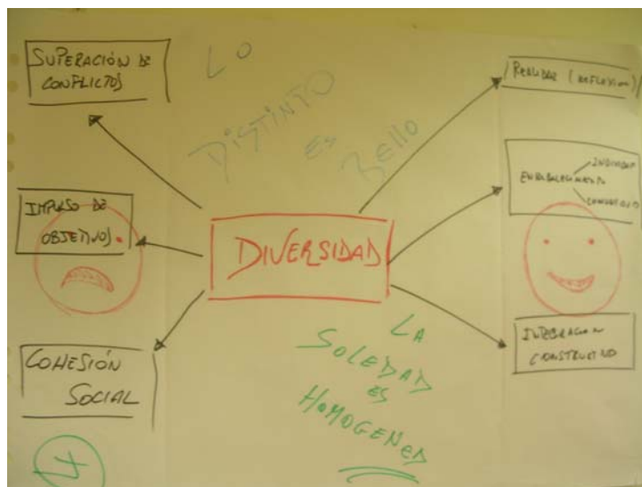
Gráfico 2: Resultado de un grupo (II)

Puede darse por concluida la reflexión sobre este aspecto de la colaboración, pasando en un momento posterior a contrastar cómo aplicará cada uno la diversidad en su asignatura o materia docente.